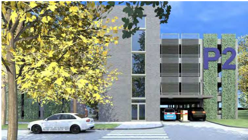
Rycina 5: Wizualizacja wielopoziomowego parkingu naziemnego