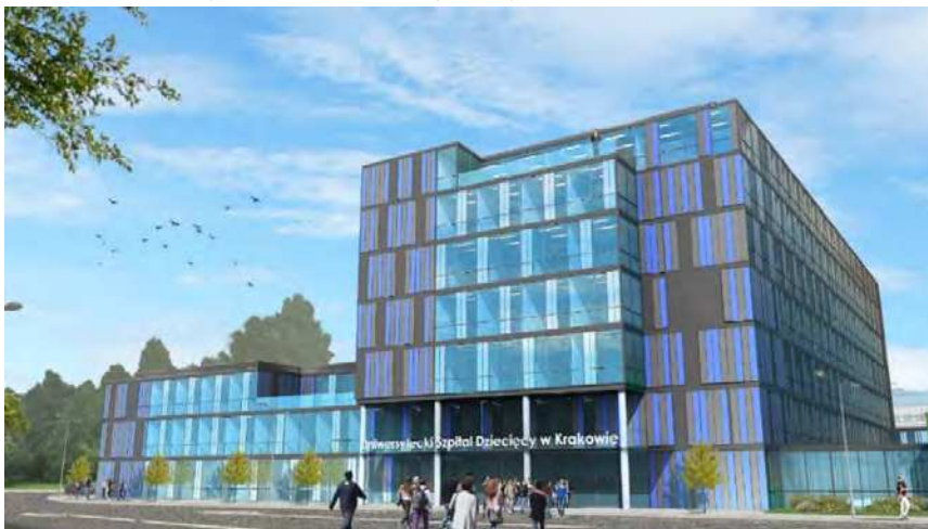
Rycina 2: Wizualizacja budynku UCP – widok 1