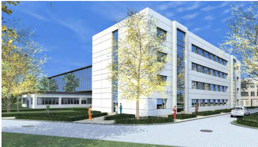
Rycina 4: Wizualizacja budynku CLS