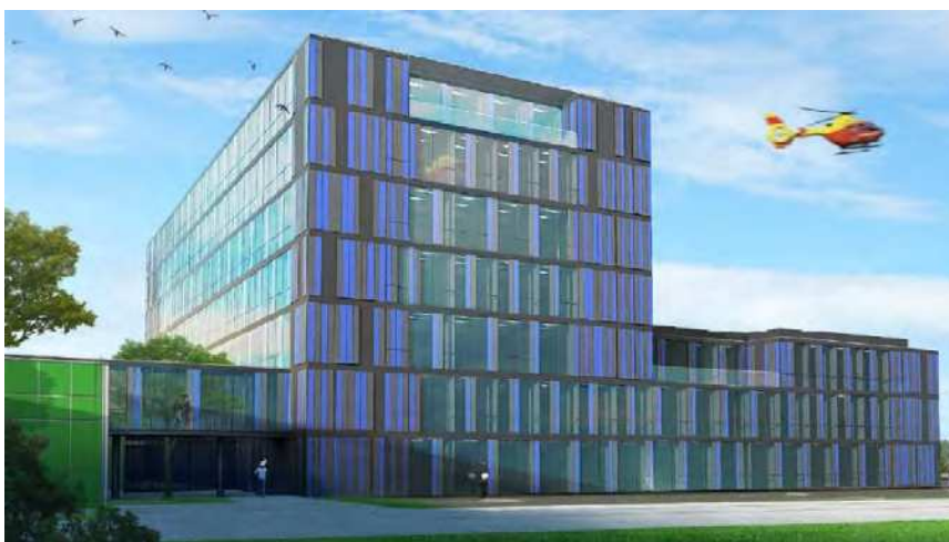
Rycina 3: Wizualizacja budynku UCP – widok 2