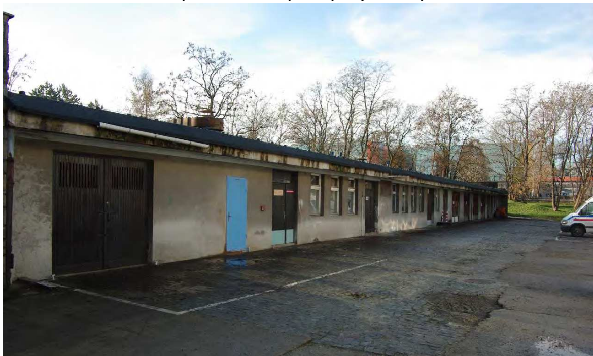
Rycina 6: Stan obecny – Budynek pomocniczy