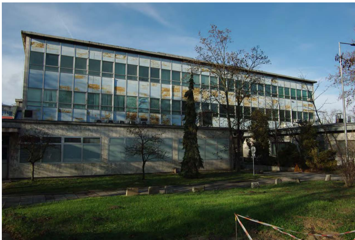
Rycina 7: Stan obecny – Budynek CLS