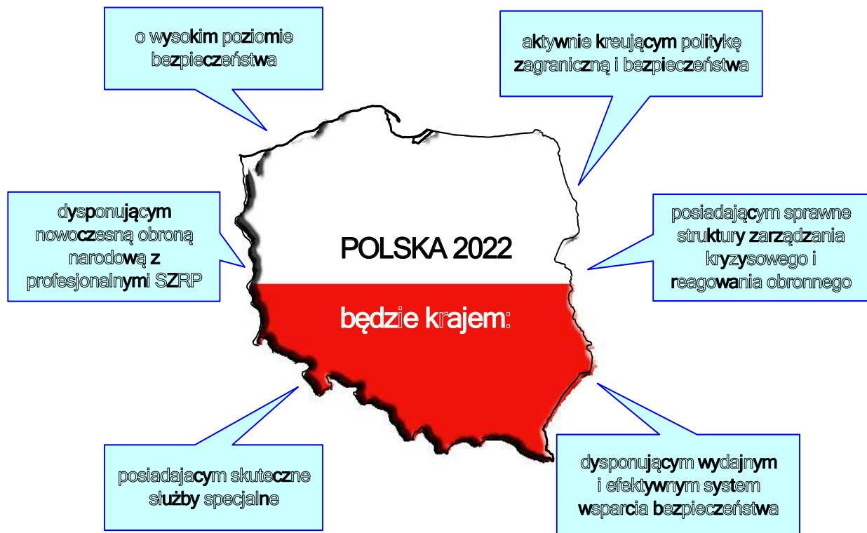
Rysunek 2. Efekty realizacji SRSBN RP