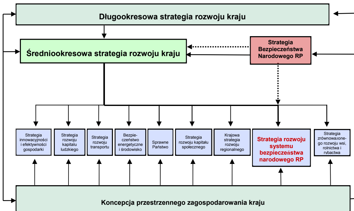
Rysunek 1. Miejsce Strategii rozwoju systemu bezpieczeństwa narodowego RP w hierarchii dokumentów strategicznych