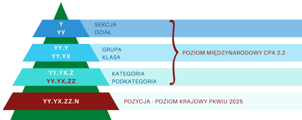
Rysunek 2. Poziomy klasyfikacji PKWiU 2025