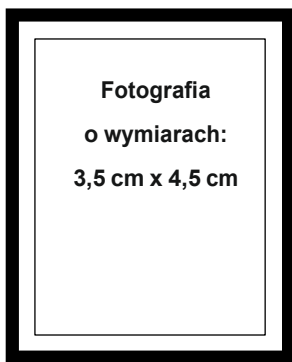
(nie wykraczać poza ramkę wewnętrzną)