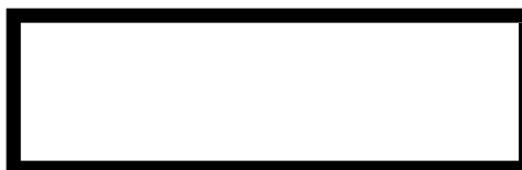
własnoręczny podpis kierowcy (podpis nie może dotykać ani przecinać ramki)