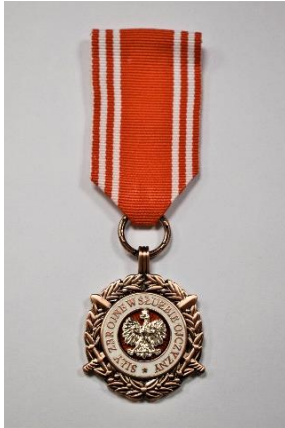
strona licowa medalu