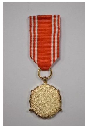
strona odwrotna medalu