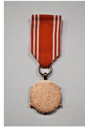
strona odwrotna medalu