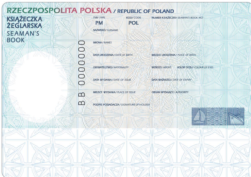
Naklejka zawierająca dane personalne