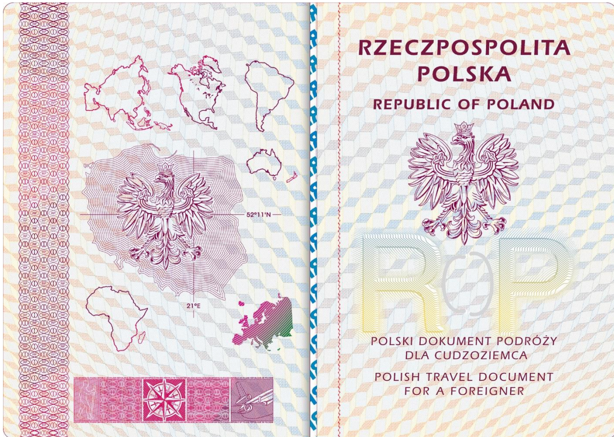
Strona 2 okładki (wewnętrzna)