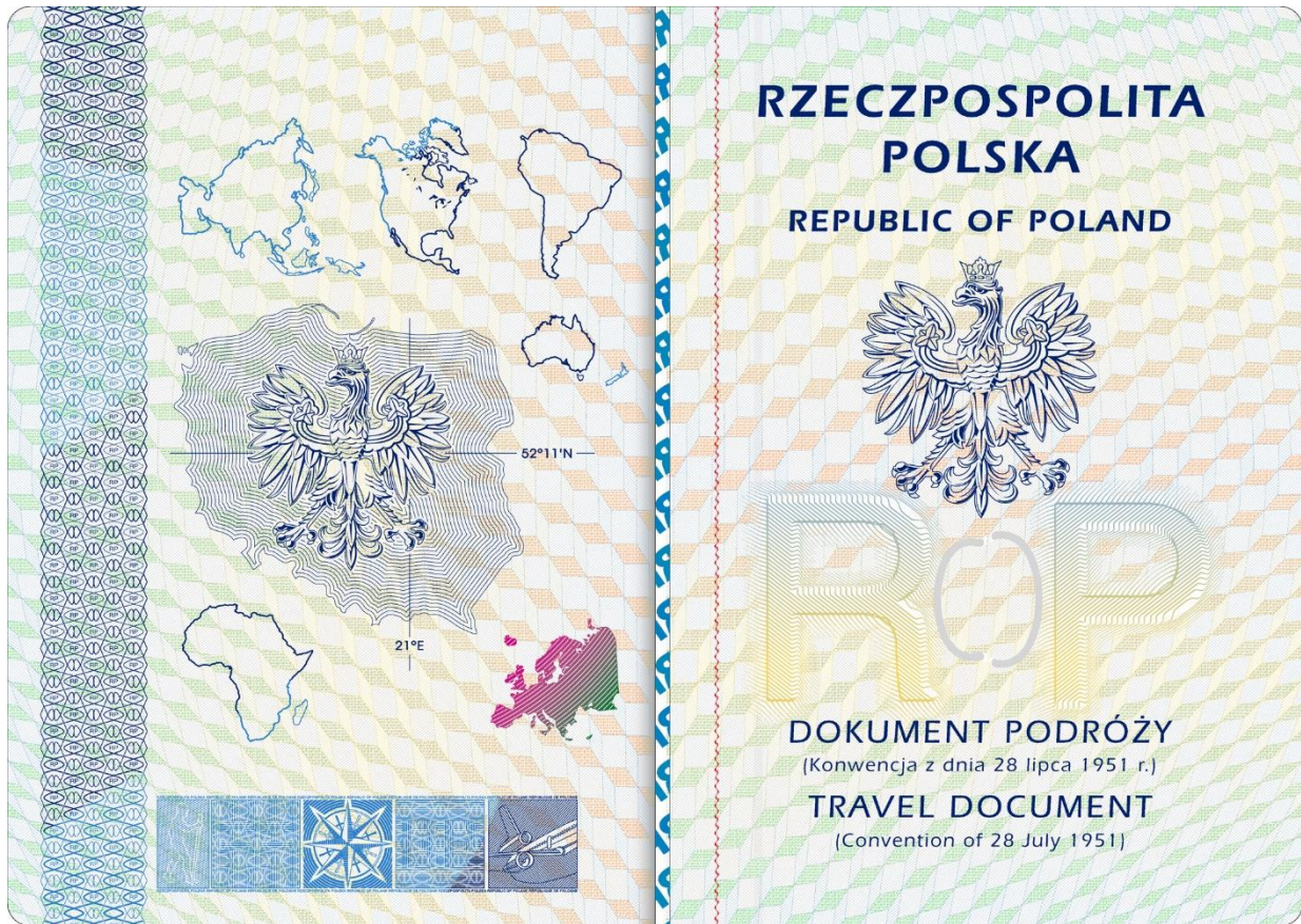
Strona 2 okładki (wewnętrzna)