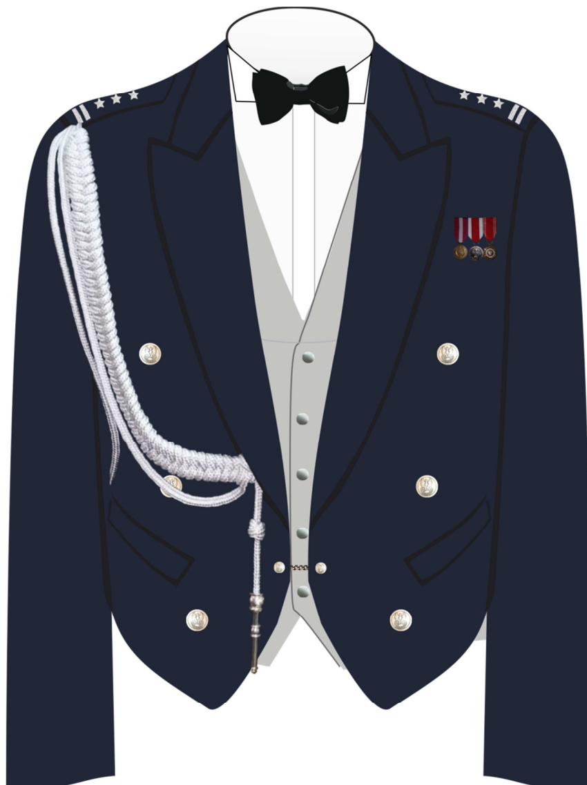
Rys. 1. Sposób noszenia miniatur orderów i odznaczeń na półfraku munduru wieczorowego.

Załącznik do rozporządzenia Ministra Obrony Narodowej z dnia 4 sierpnia 2015 r.