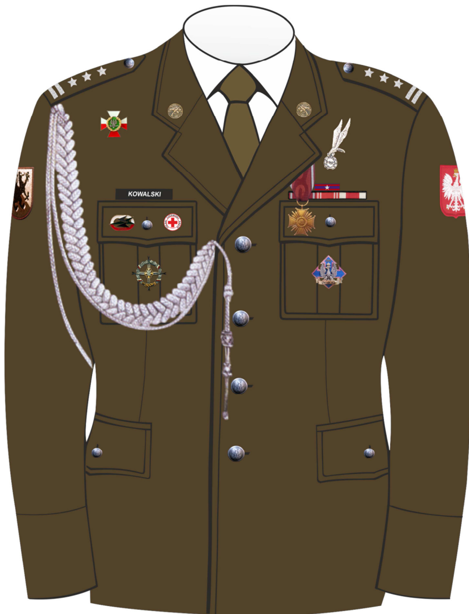
Rys. 2. Sposób noszenia odznak orderów, odznaczeń i odznak na kurtce munduru galowego Wojsk Lądowych.