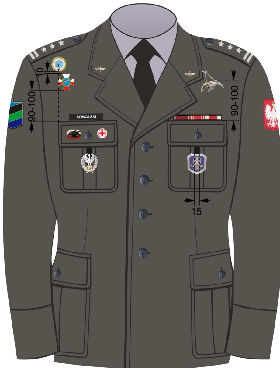
Rys. 6. Sposób noszenia baretek orderów, odznaczeń oraz odznak na kurtce munduru wyjściowego Sił Powietrznych.