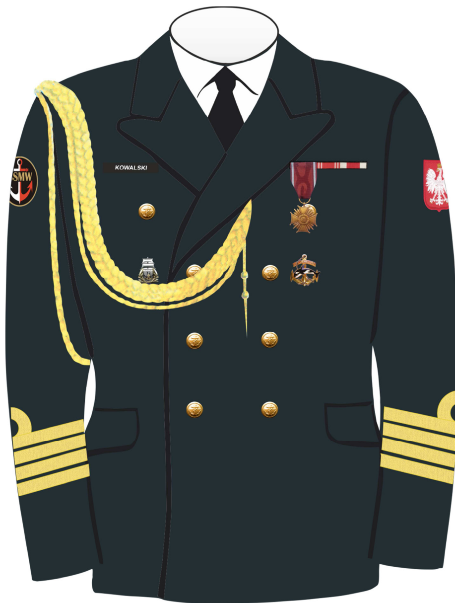
Rys. 4. Sposób noszenia odznak orderów, odznaczeń i odznak na kurtce munduru galowego Marynarki Wojennej.