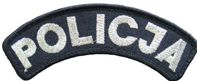
Znak do kurtki galowej i płaszcza wyjściowego całorocznego