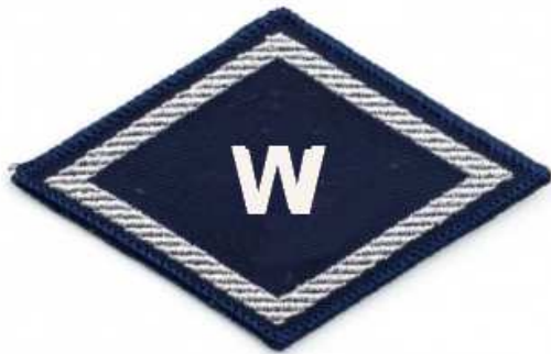
Służba spraw wewnętrznych