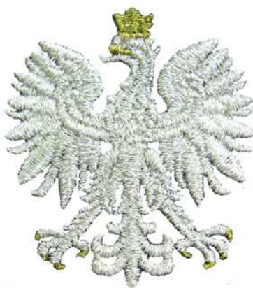
Znak generalnego inspektora i nadinspektora Policji