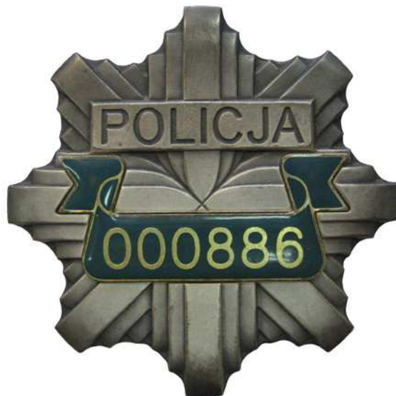
Znak identyfikacji indywidualnej policjanta