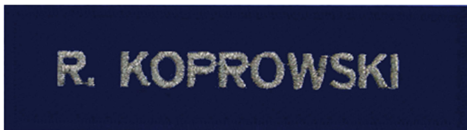
Znak identyfikacji imiennej w postaci taśmy szczepnej