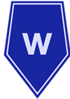
Służba spraw wewnętrznych