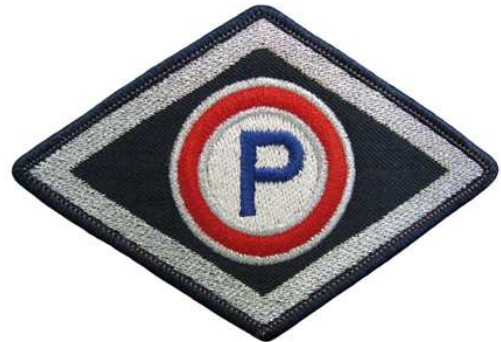
Służba prewencyjna (z wyłączeniem komórek organizacyjnych ruchu drogowego)