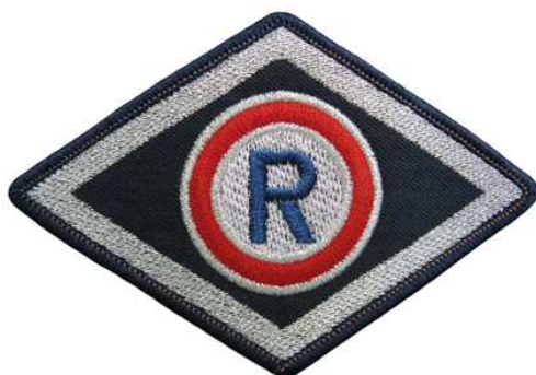
Służba prewencyjna (komórki organizacyjne ruchu drogowego)