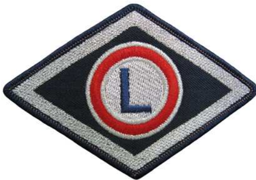
Służba wspomagająca, Wyższa Szkoła Policji w Szczytnie, szkoły policyjne i ośrodki szkolenia Policji