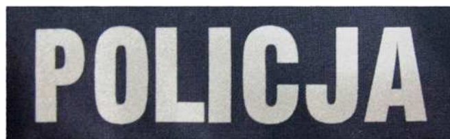
Znak do elementów ubioru służbowego i munduru ćwiczebnego