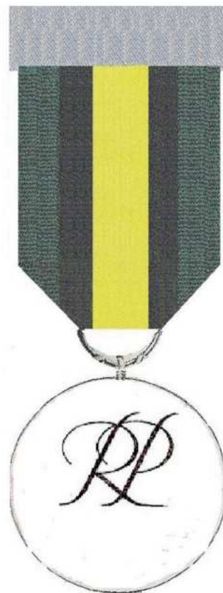
STRONA ODWROTNA Skala 1:1