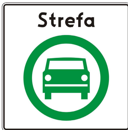
Rys. 5.2.59.1. Znak D-54

Znak D-54 „Strefa czystego transportu” stosuje się w celu wskazania granicy strefy czystego transportu. Znak ten umieszcza się na wszystkich wjazdach do strefy czystego transportu.