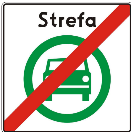
Rys. 5.2.60.1 Znak D-55

Znak D-55 „Koniec strefy czystego transportu” stosuje się w celu wskazania wyjazdu ze strefy czystego transportu. Znak ten umieszcza się na wszystkich wyjazdach ze strefy czystego transportu.”,