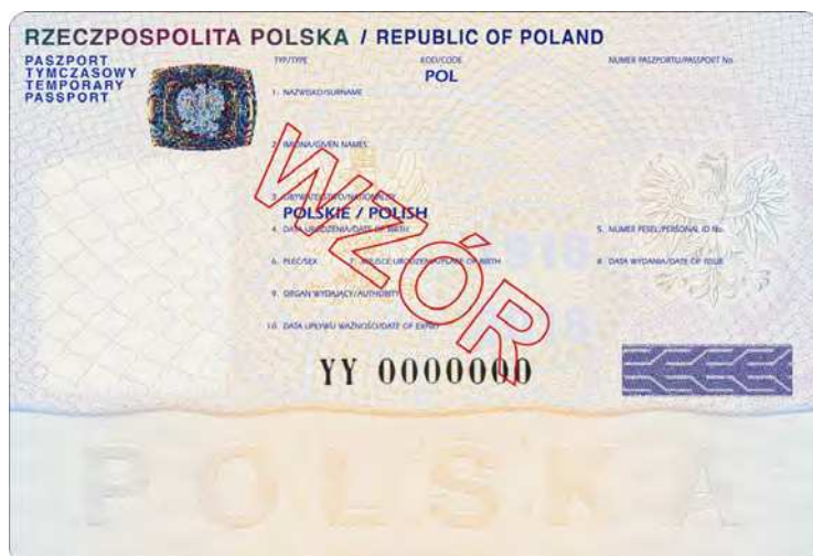
Naklejka personalizacyjna do paszportu tymczasowego