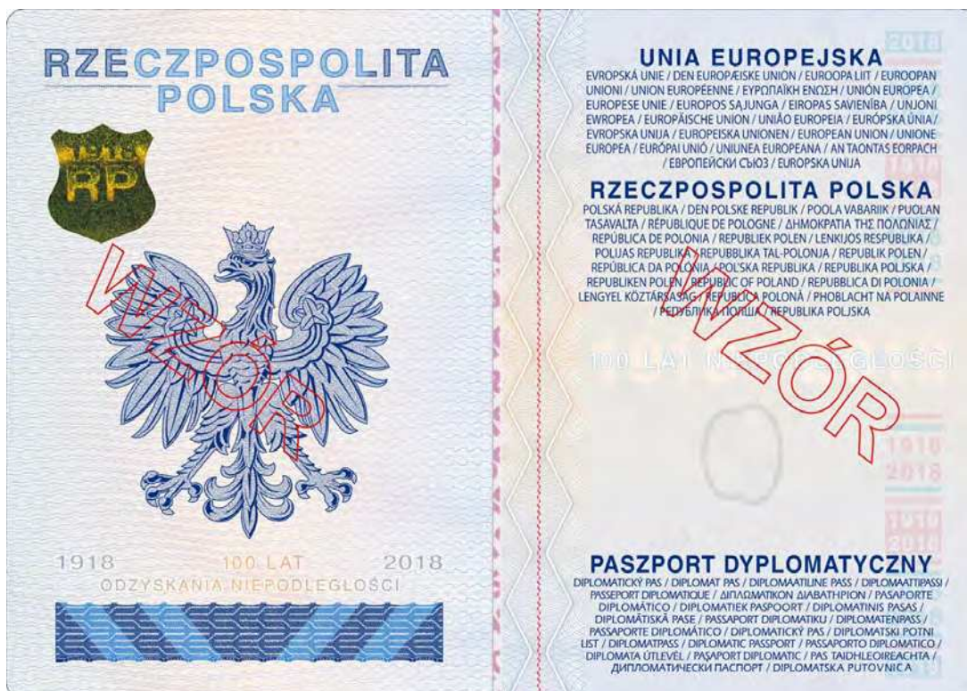
Strona 2 okładki (wewnętrzna)

Okładka zewnętrzna – koloru bordo, z tworzywa sztucznego, z wytłoczonymi bezbarwnymi elementami oraz napisami w języku polskim, angielskim oraz godłem w kolorze złotym