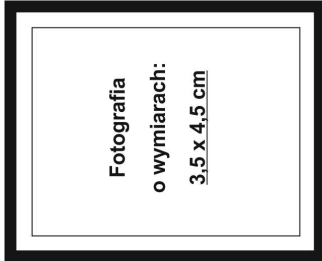
(nie wykraczać poza ramkę wewnętrzną)