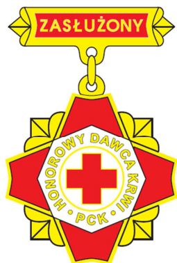
Brązowa odznaka honorowa „Zasłużony Honorowy Dawca Krwi III stopnia”