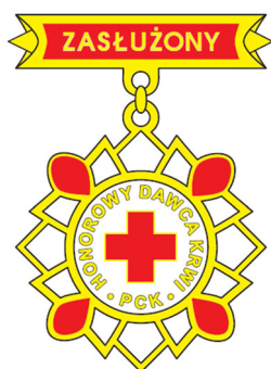
Srebrna odznaka honorowa „Zasłużony Honorowy Dawca Krwi II stopnia”