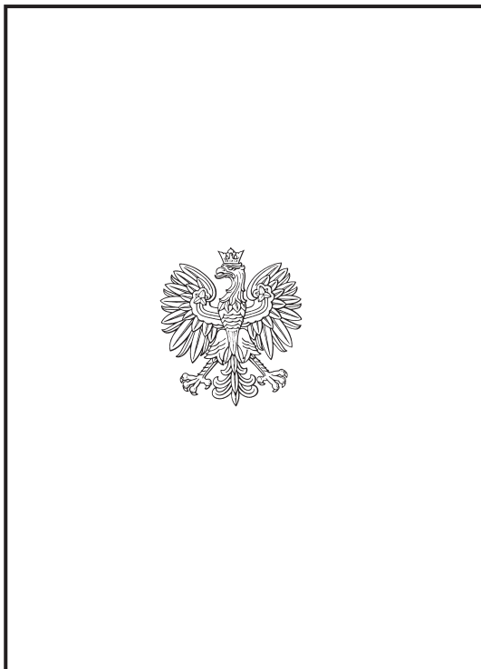
Zewnętrzna strona legitymacji