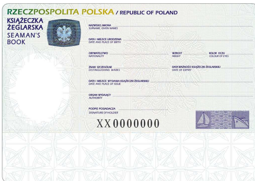
Naklejka personalizacyjna do książeczki żeglarskiej