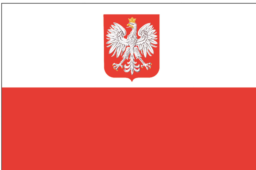
FLAGA PAŃSTWOWA RZECZYPOSPOLITEJ POLSKIEJ

Stosunek wysokości godła do szerokości flagi – wynosi 2:5