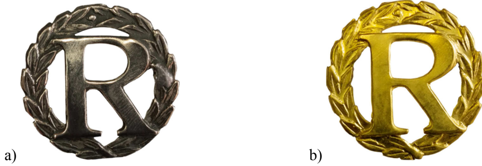
Rys. 1. Wzór oznaki identyfikacyjnej: