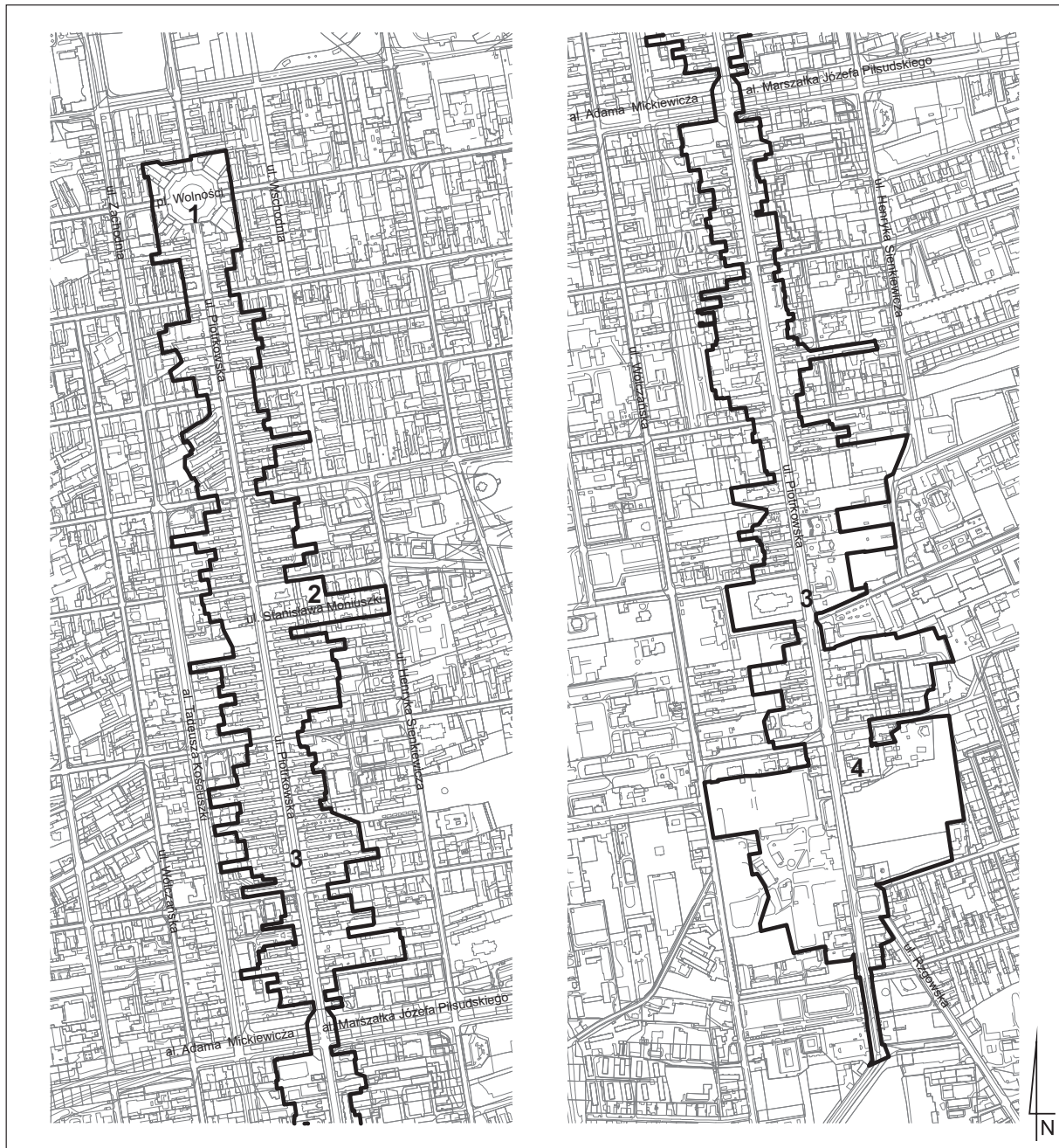
Układy urbanistyczne pl. Wolności, ul. Stanisława Moniuszki i ul. Piotrkowskiej wraz z zespołem fabryczno-rezydencjonalnym Ludwika Geyera