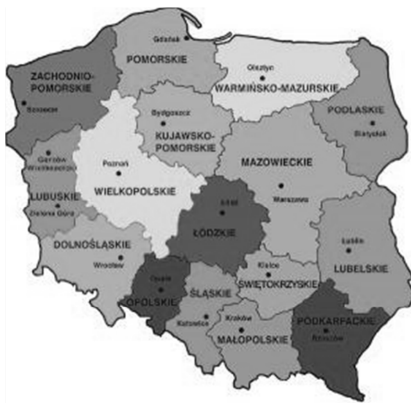
Rys. 3. Podział administracyjny Rzeczypospolitej Polskiej na województwa

Program będzie realizowany na terytorium Rzeczypospolitej Polskiej. Podział administracyjny przedstawia rys. 3