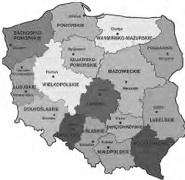
Rys. 3. Podział administracyjny Rzeczypospolitej Polskiej na województwa