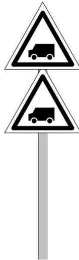
Rys. 171a Wskaźnik W 6b