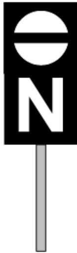
Rys. 68a Sygnał Z 1p

Załącznik do rozporządzenia Ministra Transportu, Budownictwa i Gospodarki Morskiej z dnia 6 września 2012 r. (poz. 1042)