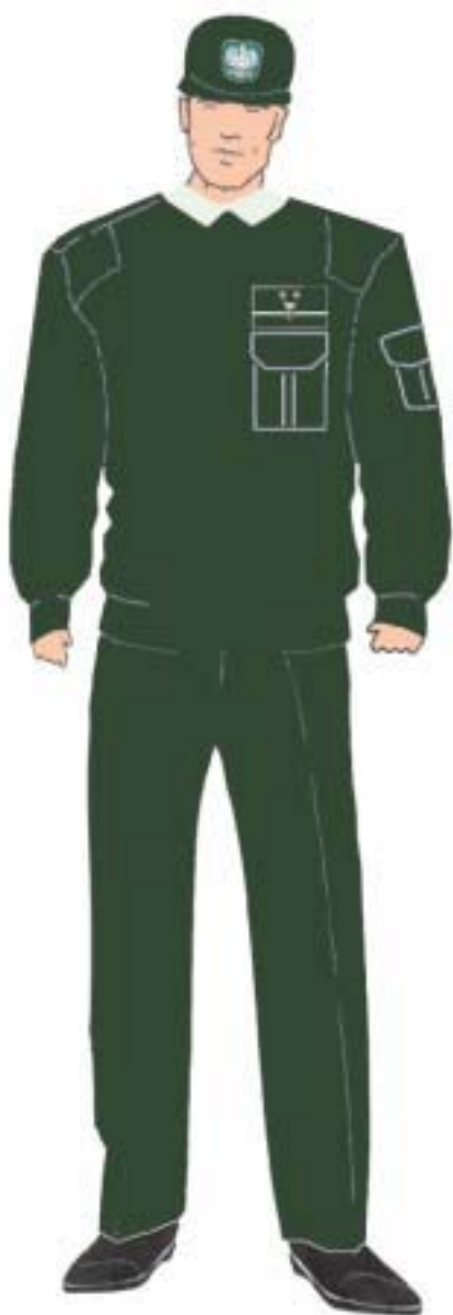
Ubiór inspektora w swetrze