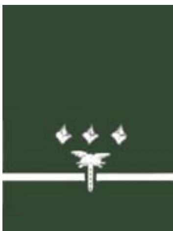
Starszy Inspektor Transportu Drogowego