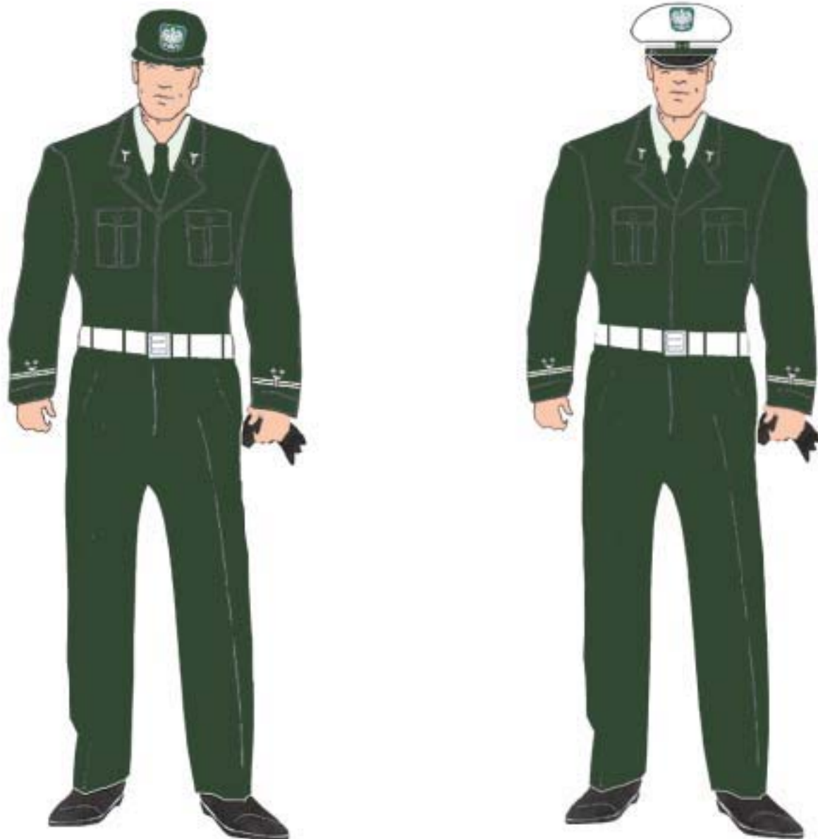
Ubiór inspektora w bluzie służbowej