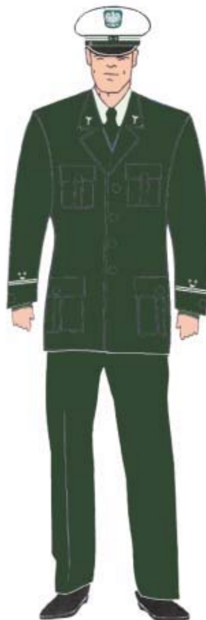
Ubiór inspektora w marynarce gabardynowej