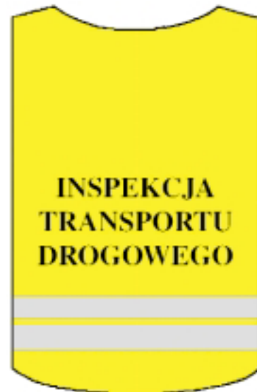
Wzór kamizelki ostrzegawczej