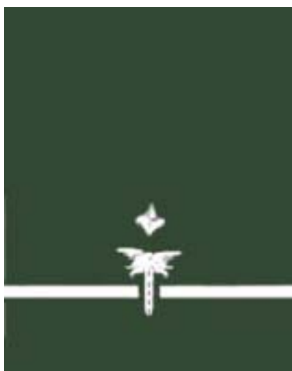
Młodszy Inspektor Transportu Drogowego