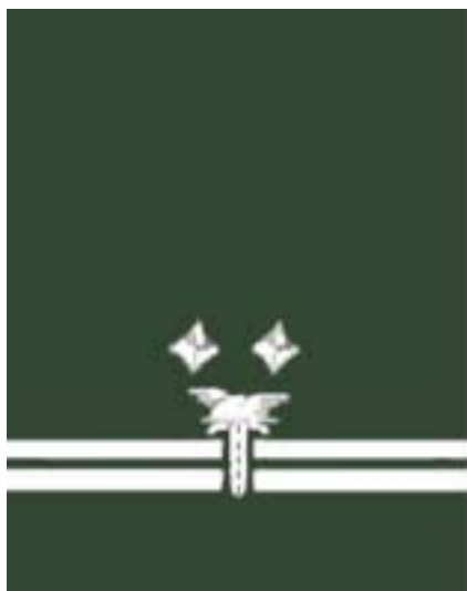
Wojewódzki Inspektor Transportu Drogowego