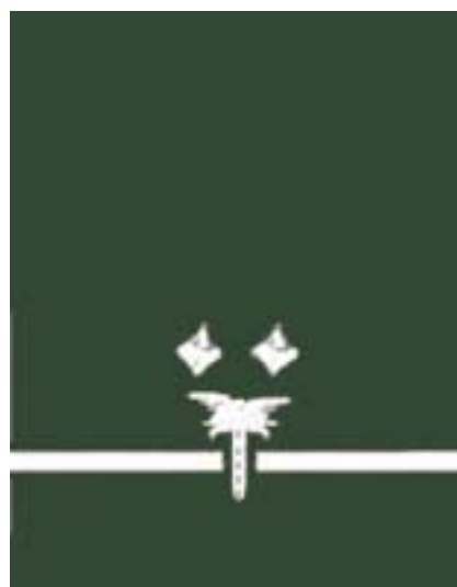
Inspektor Transportu Drogowego