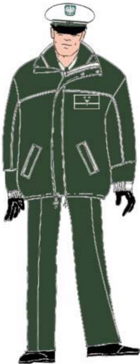
Ubiór inspektora w kurtce ocieplanej