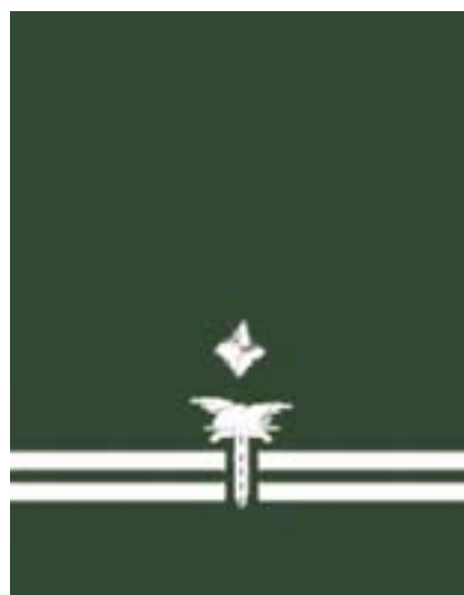
Zastępca Wojewódzkiego Inspektora Transportu Drogowego